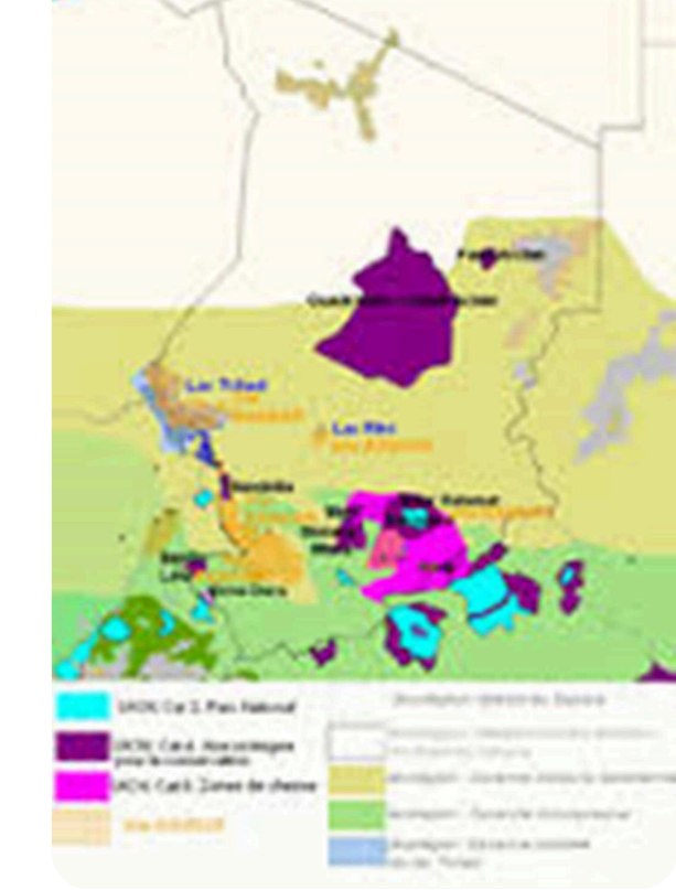
Cartes des Aires Protégées