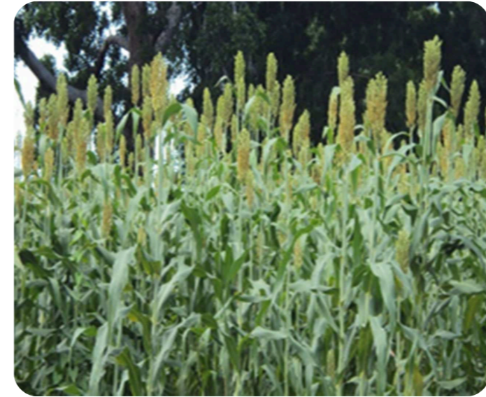
Champ de mil

Depuis 1998, le Tchad s'est engagé dans l'élaboration et la mise en œuvre des stratégies de réduction de la pauvreté. Après la Stratégie Nationale de Réduction de la Pauvreté I (SNRP), ébauchée pour la période 2003-2005, viennent la SNRP 2 pour la période 2007-2009 et plus récemment la Stratégie de Croissance pour la Réduction de la Pauvreté (SCRPR 2011-2015). Elle a pour ambition d'intensifier la croissance économique afin d'accélérer la marche du Tchad vers la réalisation des Objectifs du Millénaire pour le Développement (OMD), à l'horizon 2015. Avec une population en majorité rurale (80%), le profil économique du Tchad est largement tributaire des ressources naturelles. Le Gouvernement en accordant une place de choix à la gestion de l'environnement et des ressources naturelles dans la SNRP 2 et plus particulièrement la gestion rationnelle des forêts. Pour mettre en œuvre efficacement les orientations de la politique forestière nationale.