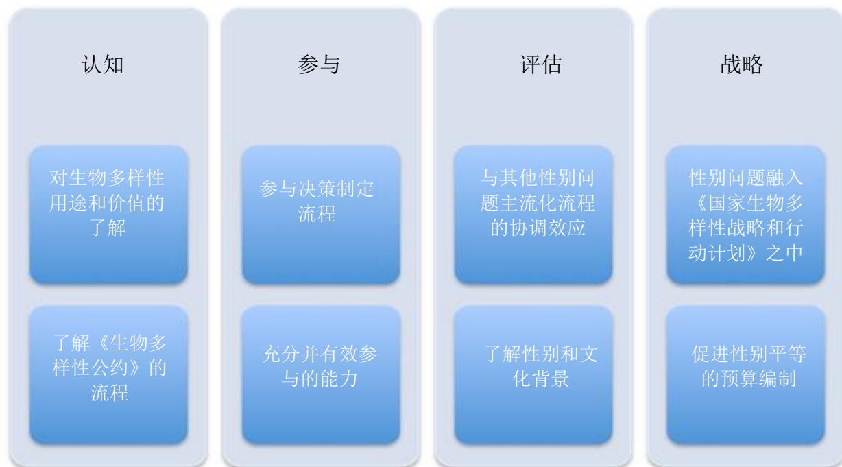
图 1：性别平等主流化的要素