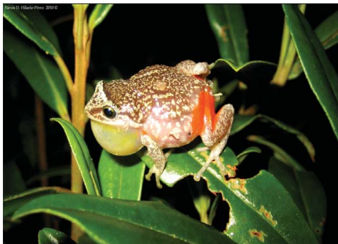
Rana de la montaña ( Eleutherodactylus patriciae )

Al presente, se reconocen 44 especies de anfibios, de las cuales 41 (93 por ciento) son endémicas. Es el grupo de vertebrados, junto a los reptiles, con mayor porcentaje de endemismos. Sólo una especie compartida con Puerto Rico ( Leptodactylus albilabris ) y dos especies introducidas ( Bufo marinus y Rana catesbeiana ) no son endémicas. Se conocen 114 especies de reptiles terrestres y de agua dulce, 105 endémicas (95.4 por ciento), tres (3) especies nativas ( Crocodylus acutus , Anolis distichus y Epicrates striatus ) y 3 introducidas ( Anolis cris-