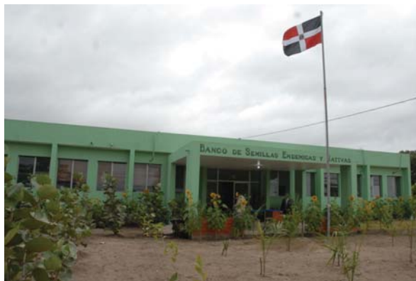
Banco de Semillas Endémicas y Nativas

El Ministerio Ambiente estableció el Banco de Semillas de especies endémicas y nativas buscando impulsar la comercialización con valor agregado y mayor sostenibilidad de especies de alto grado de amenazas e integrar más sectores a las iniciativas.