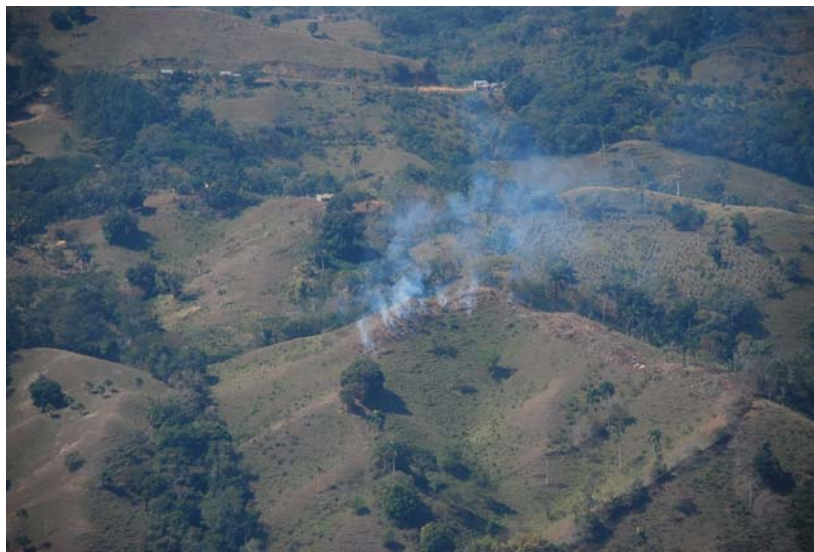
Incendio Forestal en Los Haitises, (Foto: Pedro Taveras)