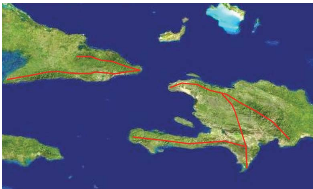
Corredor biológico del Caribe

El presupuesto total, incluyendo las instituciones adscritas, es de $4,640.1 millones. El 65% al 70% corresponde al Instituto Nacional de Recursos Hidráulicos (INDRHI), dedicados a financiar obras de infraestructura de riego. El Programa 11 relativo a la conservación de las áreas protegidas y la biodiversidad tiene un presupuesto de RD$159.1 millones (US$4.2 millones). El Programa 12, Subprograma 01, manejo de recursos forestales tiene un presupuesto de RD$325.1 millones y el Subprograma 03 recursos costeros marinos tiene RD$37.2 millones (US$1 millón). El presupuesto del Jardín Botánico es de RD$48.2 millones (US$1.3 millones), el del ZOODOM es de RD$39.8 (US$1.1 millones); el Museo Nacional de Historia Natural es de RD$23.5 millones (US$0.6 millones); y el Acuario Nacional de RD$34.0 millones (US$0.9 millones). La segregación más precisa de los montos exactos del presupuesto nacional y cooperación internacional dedicados a la biodiversidad se dificulta debido a que, prácticamente, en todos los programas del Ministerio se hacen inversiones a favor de la biodiversidad, aún no estén formalmente considerados como tales.