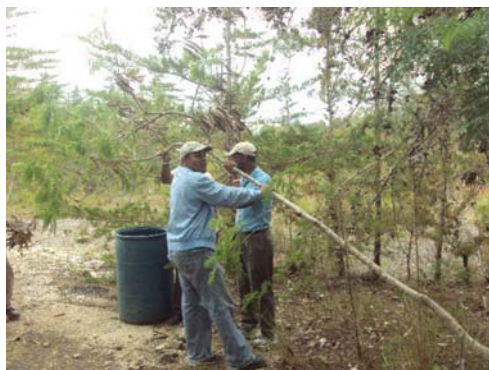
Control de Leucaena en Hoyo de Pelempito

El Ministerio Ambiente dentro del Programa de Control de Especies Exóticas Invasoras realiza campaña de concienciación a guardaparques y comunitarios en las áreas protegidas afectadas por las especies invasoras.