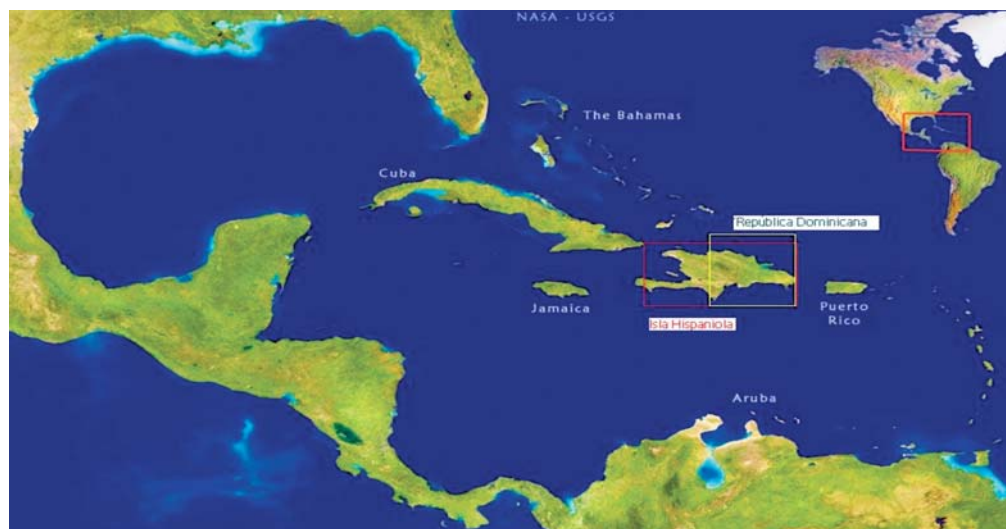
Fig. 1. Mapa de la Hispaniola /República Dominicana y su ubicación en el continente americano.

Todo esto ha formado un complejo mosaico de ambientes diferentes conformados principalmente por la altitud, la humedad y la temperatura, lo cual ha hecho que a la Hispaniola se le haya definido como “una isla de islas” (Powell et al, 1999). Diferentes estudios, con diferentes metodologías y en diferentes tiempos reflejan esta condición.