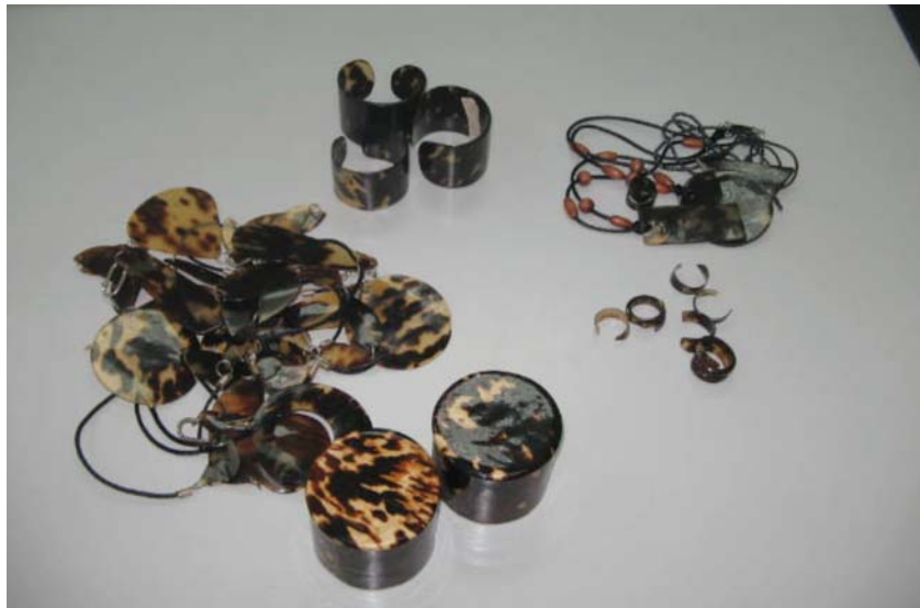
Artesanías elaboradas con concha de carey

La extracción o colecta ilegal también afecta la flora y la fauna, especialmente a los cactus y palmas. Muchos de estos procesos están aumentando y ocurren dentro de las áreas protegidas, como es el caso de los Parques Nacionales Jara-gua, Del Este y Los Haitises.