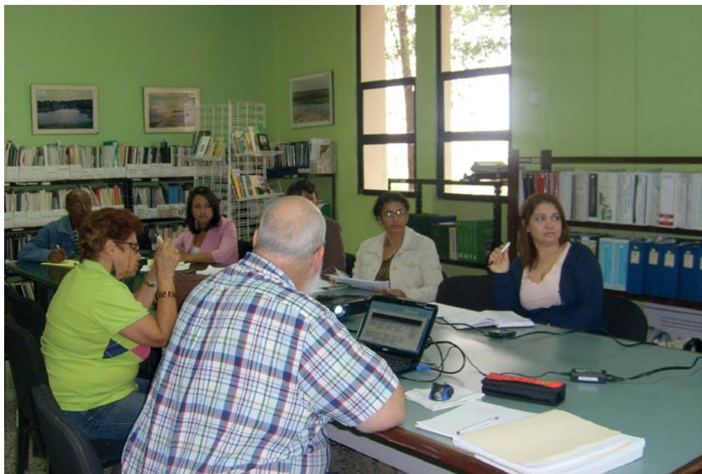
Equipo Técnico de Seguimiento (ENBPA)