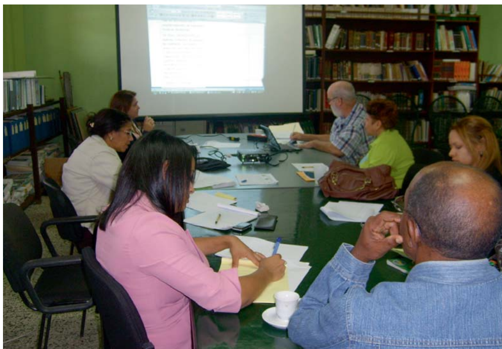
Equipo Técnico de Seguimiento (ENBPA)