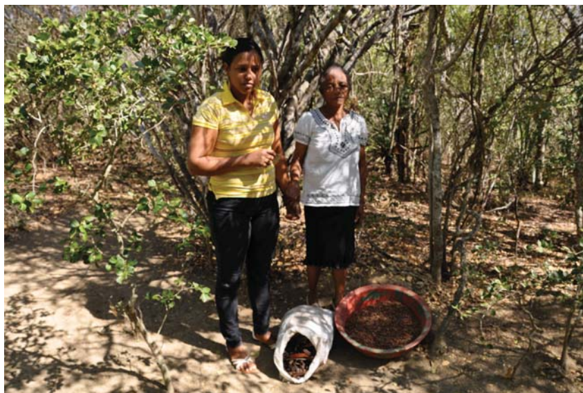
Mujeres colectoras de semillas, Reserva Científica Villa Elisa

El Departamento de Recursos Genéticos del Viceministerio de Áreas Protegidas y Biodiversidad trabaja en el Programa de Conservación ex situ e in situ de las especies endémicas y nativas. A través del mismo se realiza la colecta de semillas de especies endémicas y nativas en peligro en las áreas protegidas. Esta colecta de semillas se realiza con la colaboración de los guardaparques y comunitarios, tomando en cuenta la participación de la mujer.