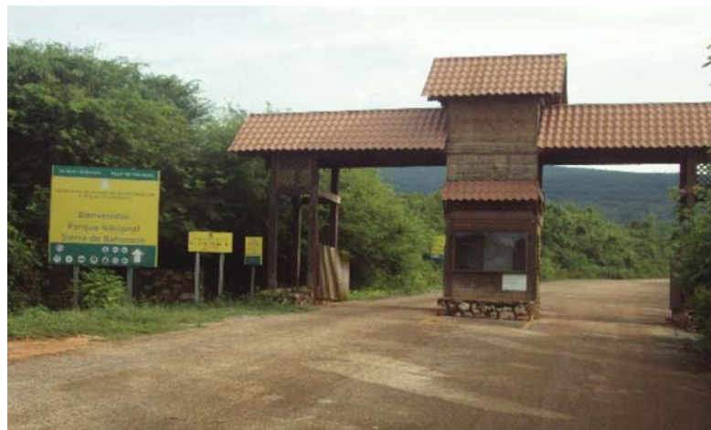
Entrada Parque Nacional Sierra de Bahoruco.

En la Sierra de Bahoruco se encuentran 1,615 especies de plantas vasculares, que representa el 29% de la flora total de la Isla. El endemismo de Bahoruco asciende a 37.9% superando el 36% correspondiente al endemismo de toda La Hispaniola (García et al., 2001). Existe también una importante fauna de anfibios, todos endémicos de la Hispaniola, y más de la mitad de las especies presentes, endémicas de esta Sierra.