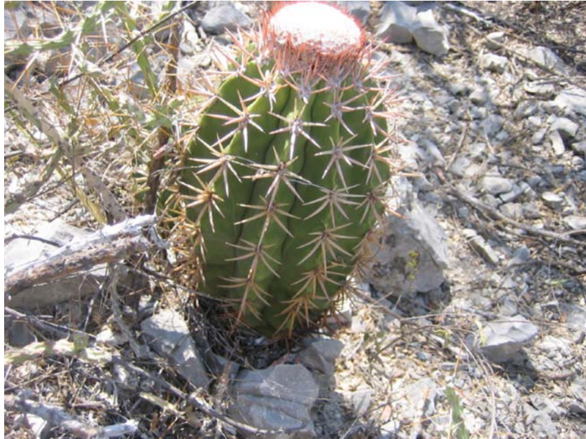
Melocactus sp.

Estos factores, junto con el irrespeto a las leyes (cumplimiento con el tamaño y límite establecidos) y la negligencia a observar los periodos de veda han resultado en una sobre explotación del número de peces, interrupciones en las cadenas de alimentación, declives en el funcionamiento del ecosistema, y la extracción excesiva de especies específicas a través de la caza.