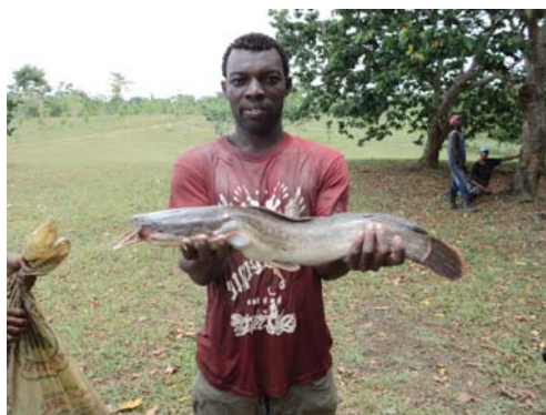
Pez león ( Pterois volitans )