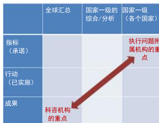
图 2：执行问题附属机构审查的事项对比科咨机构审查的事项

24. 执行问题附属机构在会议上应邀审查对国家、区域和其他措施的分析/综合，包括依据战略计划酌情制定的指标，并根据第 X/2 号决定第 17(b)段评估这些国家和地区指标对实现全球指标的促进作用。请执行秘书在筹备直至 2020 年的各届缔约方大会时提供这种分析/综合。