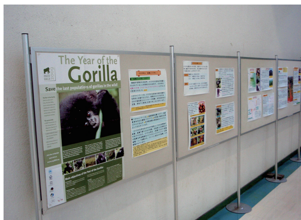
国際ゴリラ年企画展示の様子