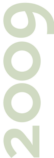
国際ゴリラ年ロゴマーク

動物園は一般の方々にとっては、まだまだレクリエーション施設と思われがちです。しかし、そうした楽しい気分で園内を巡っていたきながら、生物多様性の重要性について少しでも思いを馳せる機会を提供できたら、そして、動物園や水族館で過ごした方たちが生物多様性の保全に向けて実際に行動を起こしていただけたら、なんと素晴らしいことでしょう。そう願いつつ、これからも動物園という場で活動していきたいと思っています。