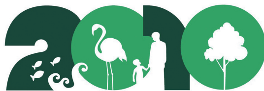
2010年 国際生物多様性年