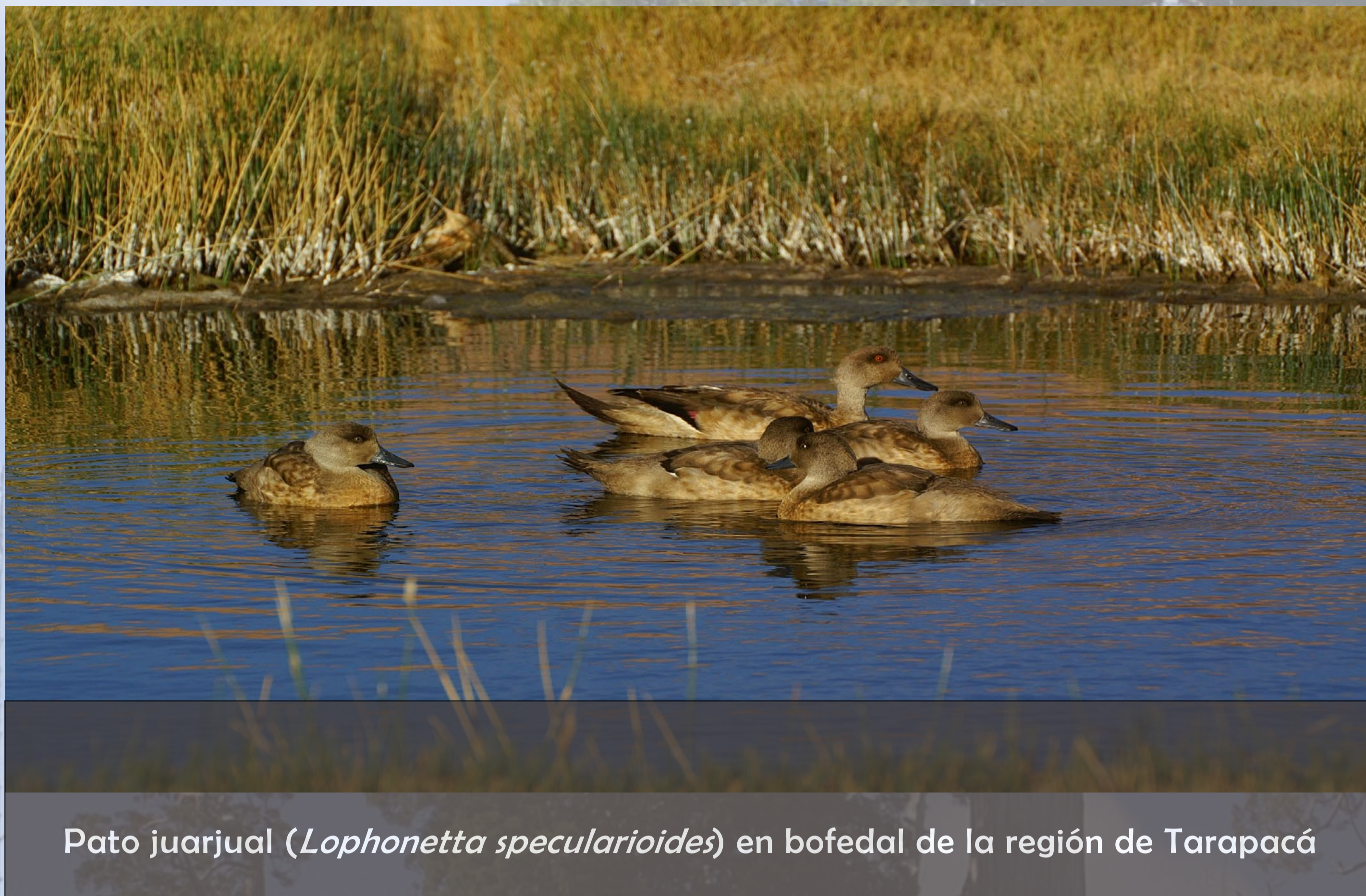
Pato juarjual ( Lophonetta specularioides ) en bofedal de la región de Tarapacá

Zona Altiplánica de la región de Tarapacá a 3.500 mtrs de altura