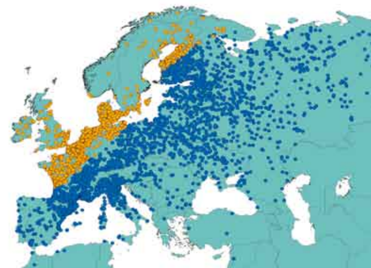
Figure 1 : localisation des reprises de Sarcelles d'hiver baguées à la Tour du Valat, Camargue. En bleu les reprises dans la voie de migration Méditerranéenne, en rouges celles dans la voie Nord-Ouest Européenne. D'après Guillemain et al. (2005). Ibis 147 : 688-696.

Pour les oiseaux d'eau, la France est schématiquement traversée par deux voies de migration, l'une le long de la Mer du Nord, la Manche et l'Atlantique, l'autre le long des vallées du Rhin et du Rhône, jusqu'à la côte méditerranéenne. Les limites des voies de migration ne sont cependant pas toujours clairement identifiées. En effet, une analyse récente a montré que 20% des sarcelles d'hiver ( Anas crecca ) baguées en Camargue, donc localisées dans la voie de migration Méditerranéenne (en bleu sur la carte), sont en fait reprises dans la voie « Nord-Ouest Européenne » (en rouge sur la carte). Il semble nécessaire d'approfondir la notion de voies migratoires et d'en préciser les limites, d'autant que la taille des populations de chaque espèce dans ces voies sert de référence à l'identification des sites d'importance internationale. Il s'agit du critère 6 relatif à la présence d'1% des individus d'une population d'une espèce ou sous-espèce d'oiseau d'eau.