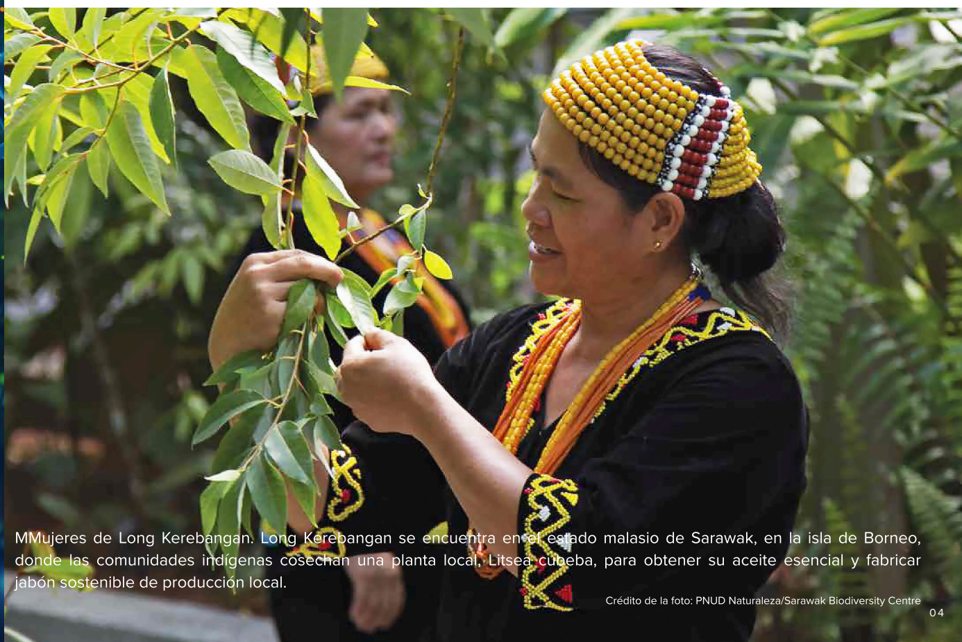
MMujeres de Long Kerebangan. Long Kerebangan se encuentra en el estado malasio de Sarawak, en la isla de Borneo, donde las comunidades indígenas cosechan una planta local, Litsea cubeba, para obtener su aceite esencial y fabricar jabón sostenible de producción local.

Si está interesado en contribuir a través de su Gobierno, pero no está seguro de si se ha establecido o se establecerá un sistema de este tipo, puede ponerse en contacto con el punto focal nacional de su Gobierno: www.cbd.int/information/nfp.shtml