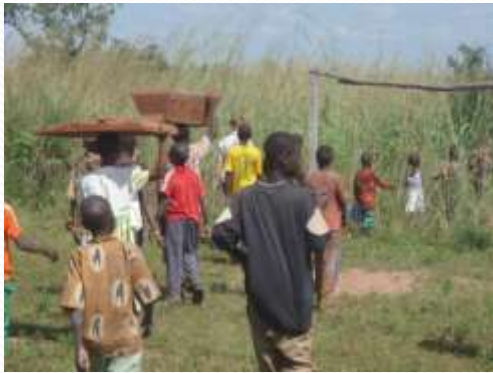
Formation sur les techniques D'installation d'une ruche