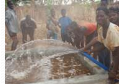
Technique de production des produit maraicher améliorée