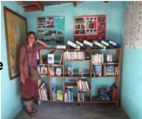
Création de la bibliothèque rurale ambulante