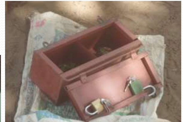
Initiation des cotisations/ tontines aux femmes