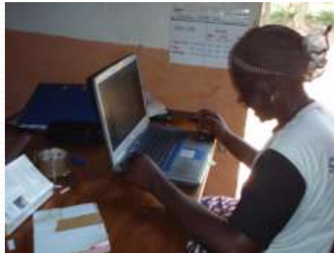
Création d'un centre de formation en informatique au siège REDERC