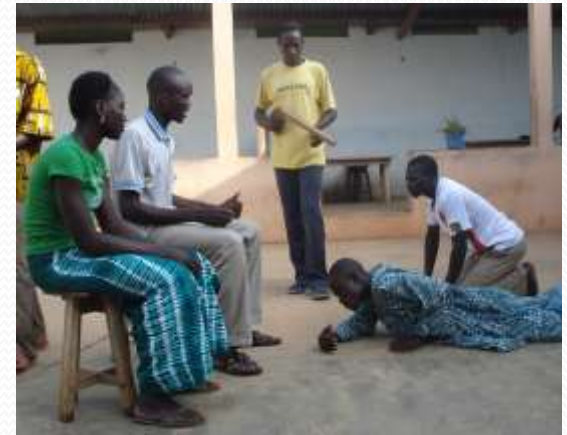
Réalisation de théâtre et sketches sur les enjeux environnementaux avec les Associations d'élèves, écoliers et étudiants