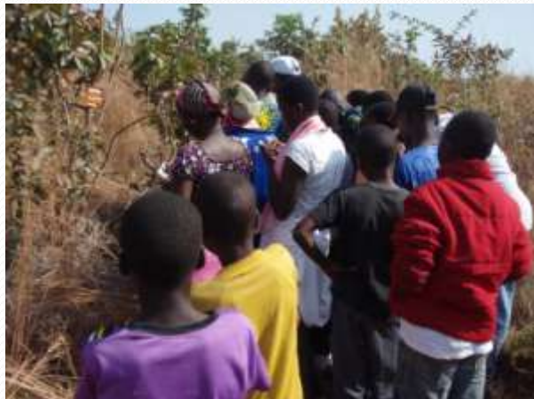
Clubs environnementaux dans les écoles de la région (Action dans 34 écoles)