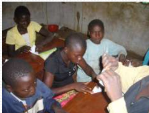
Organisation de travaux manuels et sorties pédagogiques