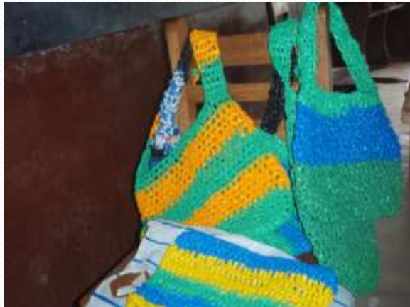
Activités de recyclage (sachets plastiques encombrants)