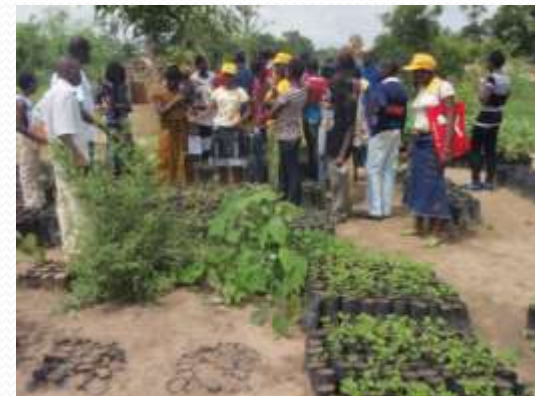
Technique d'installation d'une pépinière en plants Forestiers