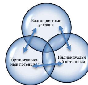
График 1. Взаимодействия

12. Виды потенциала, необходимого для достижения целей в области биоразнообразия, можно объединить в различные категории. Они могут быть объединены в категории «технических» возможностей (которые относятся к конкретному сектору или тематической области, например, к сельскому хозяйству, лесному хозяйству и т.д.) и «функциональных» возможностей (которые необходимы повсеместно, вне зависимости от сектора или области; в их число входит планирование, составление бюджета, разработка политики, финансовый анализ, формулирование стратегии и коммуникация) 8 . В целом, функциональные возможности, которые наиболее остро