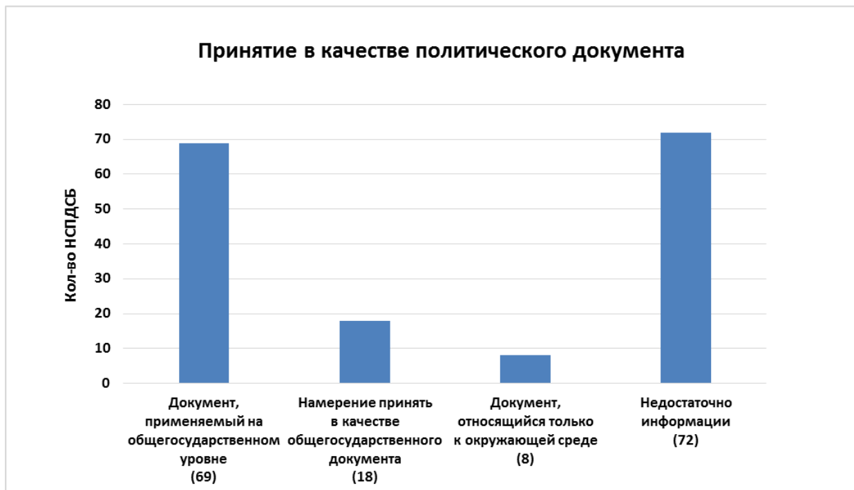
Рис. 1. Принятие НСПДСБ в качестве политического документа

20. Доля Сторон, проинформировавших секретариат о принятии их НСПДСБ в качестве документов, применяемых на общегосударственном уровне, менялась в зависимости от источника финансирования. Тогда как более 50 % Сторон, не отвечающих критериям финансирования по линии Глобального экологического фонда, приняли свои НСПДСБ в качестве политических документов, применяемых на общегосударственном уровне, это сделали лишь 36 % Сторон, сотрудничавших с Программой развития Организации Объединенных Наций, и 22 % Сторон, сотрудничавших с Программой Организации Объединенных Наций по окружающей среде как осуществляющим учреждением. В общей сложности 33 % Сторон, имеющих доступ к средствам ГЭФ через механизм прямого доступа, приняли свои НСПДСБ в качестве документов, применяемых на общегосударственном уровне. Даже если бы все Стороны, выразившие намерение принять свои НСПДСБ в качестве политических документов, приняли бы их в качестве политических документов, применяемых на общегосударственном уровне, доля Сторон, не получающих финансирования ГЭФ, была бы значительно больше. Однако в отношении более чем половины НСПДСБ (52 %) не было возможности сделать вывод касательно их статуса политического документа. В таблице 2 эта информация представлена с разбивкой по источникам финансирования.