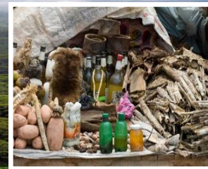
PARTAGE JUSTE ET EQUITABLE