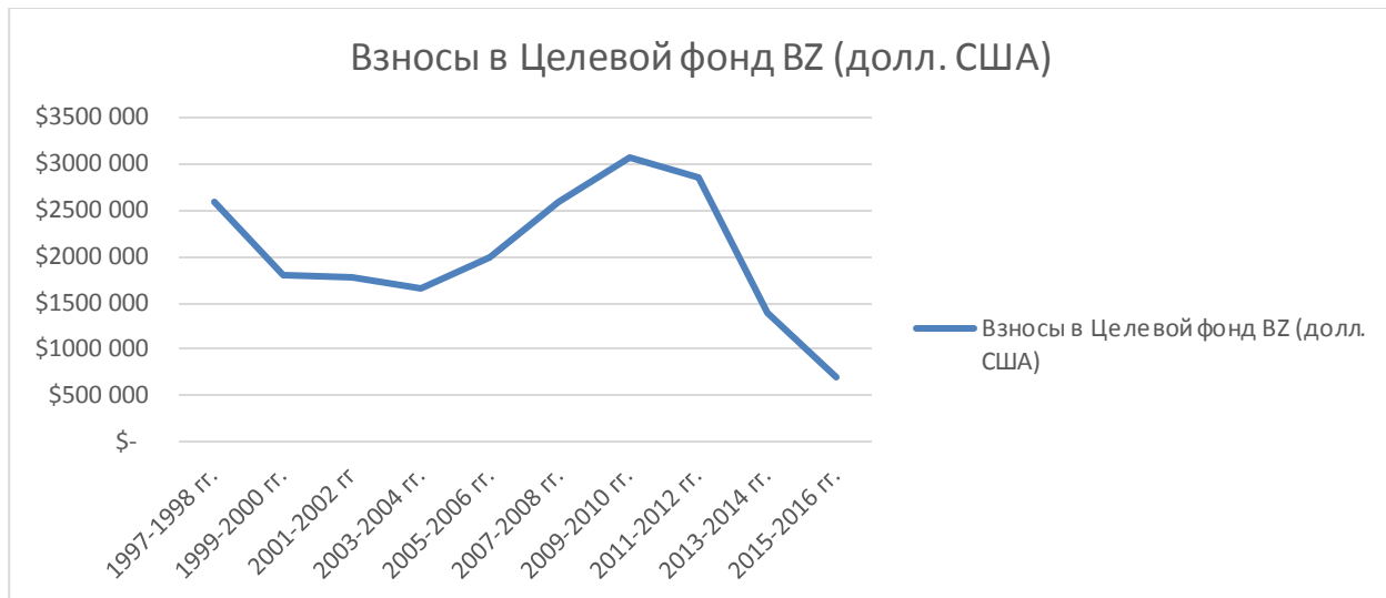
Диаграмма 1. Тенденция в отношении взносов в Целевой фонд ВЗ за 1997-2016 гг.