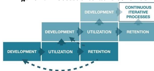
Figure 2. Processus itératifs continus

supplémentaire des capacités, car la mise en œuvre et la pratique renforcent la compréhension et les compétences.