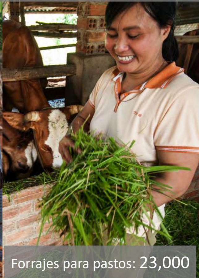
Forrajes para pastos: 23,000