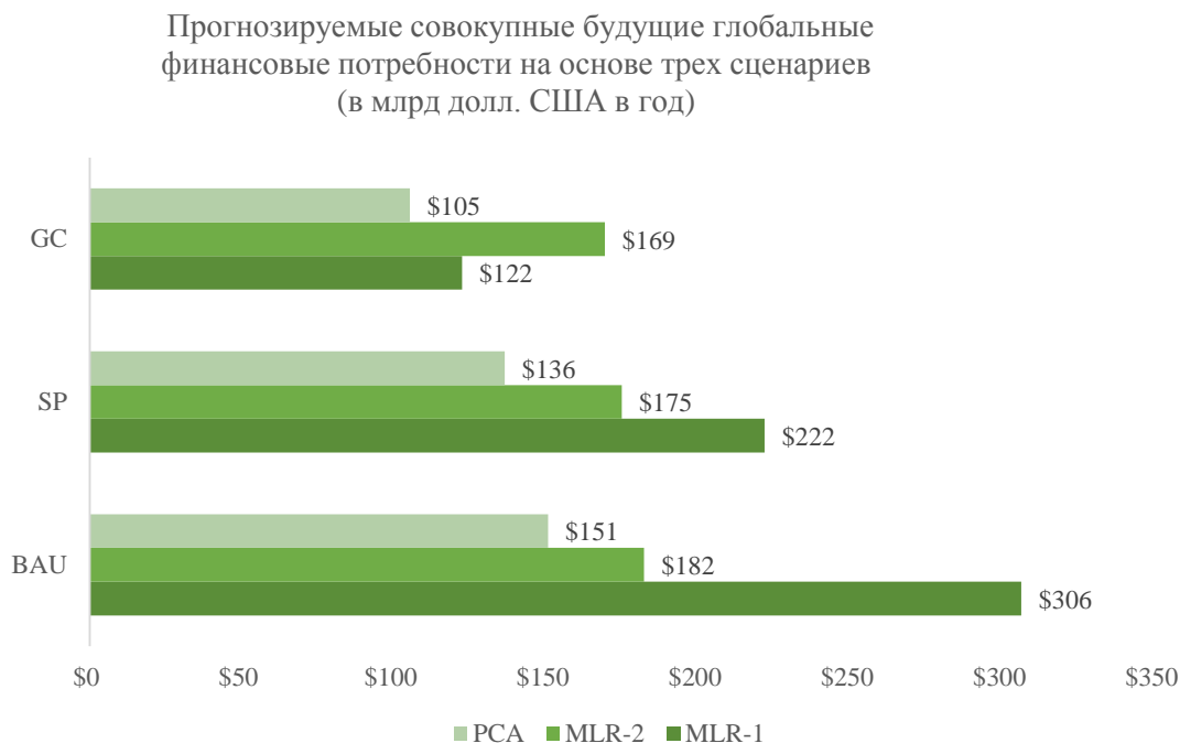
График 1. Агрегированные прогнозы глобальных финансовых потребностей в будущем, рассчитанные с использованием метода главных компонентов (МГК) и двух моделей многомерной линейной регрессии (МЛР-1, МЛР-2)

Примечание: сценарии: GC – глобальное сохранение, SP – устойчивое развитие, BAU – инерционный сценарий.