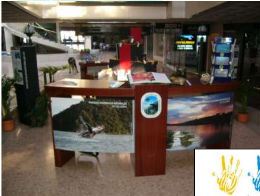
Centro Comercial Andino - Bogotá