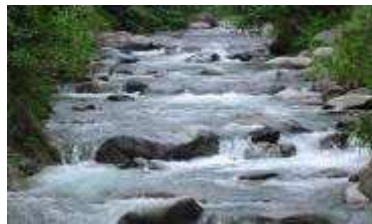
Parque Nacional Armando Bermúdez