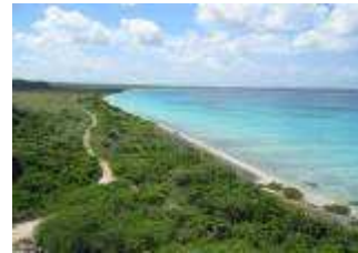
Parque Nacional Jaragua