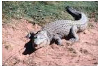
Parque Nacional Lago Enriquillo