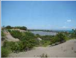
Monumento Natural Dunas de las Calderas