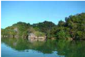
Parque Nacional Los Haitises