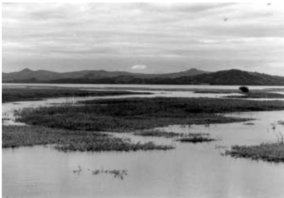
Lago de Güija, San Diego - La Barra (límitrofe con Guatemala) El Salvador C.A.