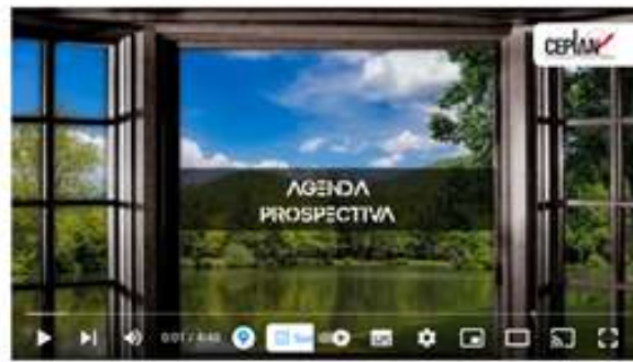
Mayor pérdida de biodiversidad y degradación de ecosistemas | Ep. 21 |